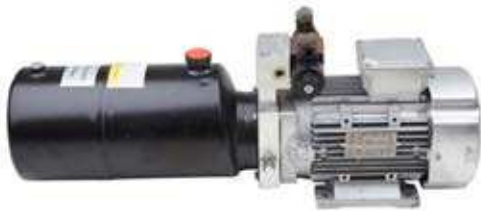
Abbildung mit einem E-Ventil