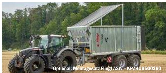
Optional: Montagesatz Fliegl ASW – KPZHUB500260